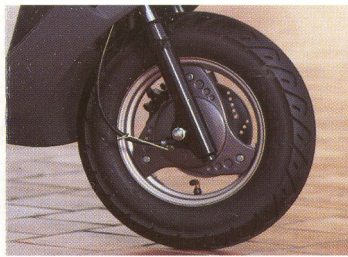
Die große vordere Scheibenbremse

Der Suzuki AN 125 gibt seinem Besitzer auf komfortable Weise Flexibilität und Mobilität. Parkplatzprobleme werden zu einem Fremdwort. Sauber und zuverlässig trägt der AN 125 seinen Fahrer durch den Stadtverkehr. Sein breites Leistungsspektrum und sicheres Handling machen diesen Roller wendig und durchzugsstark. Auf weniger guten Straßen schluckt die Federung jede Menge Unebenheiten. Und Stauraum gibt es reichlich. Darin lassen sich Einkäufe bequem nach Hause transportieren.