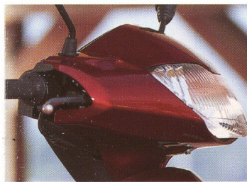
Der in die Cockpitverkleidung integrierte Scheinwerfer

konstruktion sorgen für hervorragenden Federungs- komfort und angenehm ruhiges Fahrverhalten.